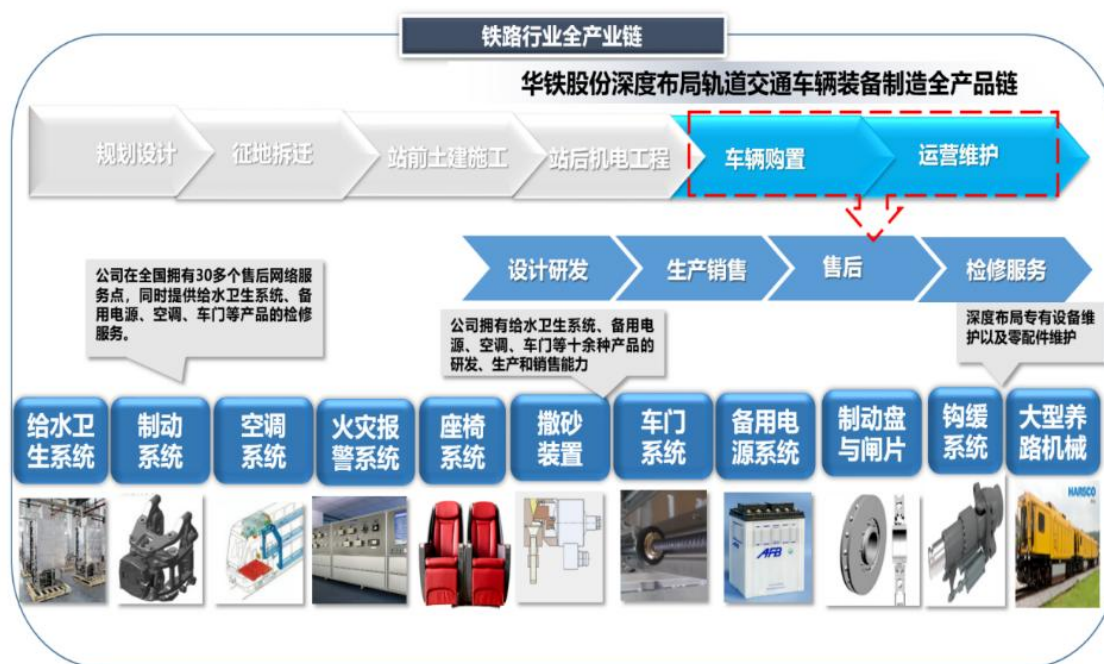
图2 轨交核心零部件大平台业务模式

公司深耕轨道交通装备制造行业，形成了全方位覆盖轨道交通装备制造核心零部件的商业模式，具备产品自主研发升级的能力以及可持续发展潜力。公司在依托现有业务的基础上，不断增加产品种类，开拓铁路“后市场”维保领域，打造完整的轨道交通核心零部件大平台。